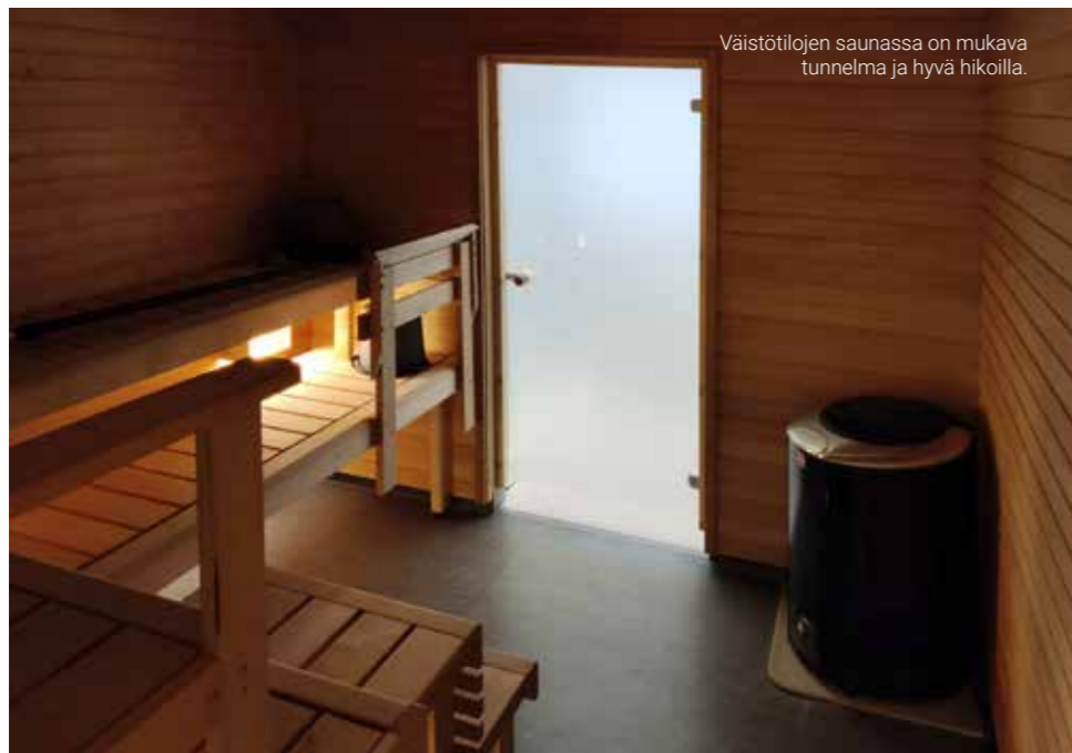
Väistötilojen saunassa on mukava tunnelma ja hyvä hikoilla.