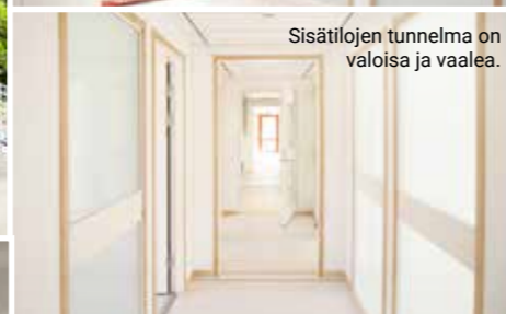
Sisätilojen tunnelma on valoisa ja vaalea.