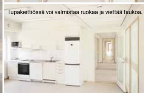
Tupakeittiössä voi valmistaa ruokaa ja viettää taukoa.