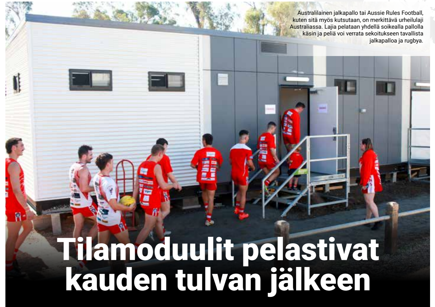
Australilainen jalkapallo tai Aussie Rules Football, kuten sitä myös kutsutaan, on merkittävä urheilulaji Australiassa. Lajia pelataan yhdellä soikealla pallolla käsin ja peliä voi verrata sekoitukseen tavallista jalkapalloa ja rugbya.

Algeco on edustettuna suuressa osassa maailmaa. Jokaisessa Algeco News-numerossa nostetaan esille yrityksen monia jännittäviä projekteja eri maista. Tässä numerossa suuntaamme Australiaa.