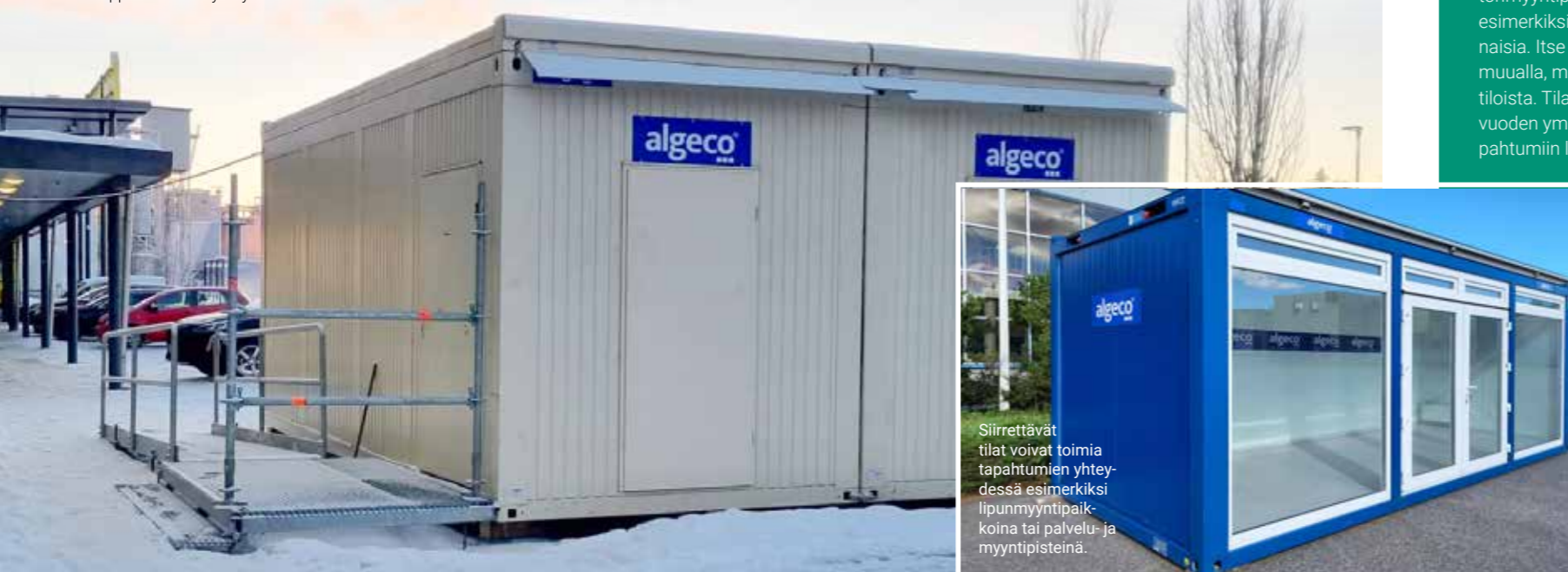
Siirrettävät tilat voivat toimia tapahtumien yhteydessä esimerkiksi lipunmyyntipaikkoina tai palvelu- ja myyntipaikoina.

Siirrettäviä äänestystiloja sijoitettiin Lahden kauppakeskusten yhteyteen.