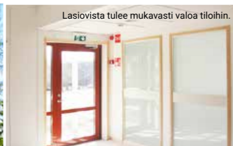
Lasiovista tulee mukavasti valoa tiloihin.