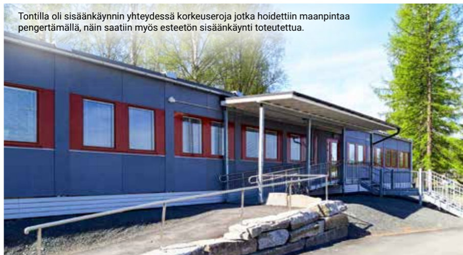
Tontilla oli sisäänkäynnin yhteydessä korkeuseroja jotka hoidettiin maanpintaa pengertämällä, näin saatiin myös esteetön sisäänkäynti toteutettua.

Yhteenvetona Kellokumpu vielä tiivistää tyytyväisyyden: Tilat olivat hyviä ja näppäriä. Porukka hitsautui yhteen, kun oltiin samoissa tiloissa. Ilmapiiri parani. Yhtenäisyys kasvoi. ■