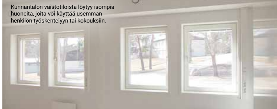
Kunnantalon väistötiloista löytyy isompia huoneita, joita voi käyttää useamman henkilön työskentelyyn tai kokouksiin.